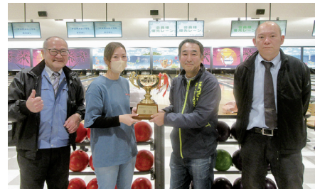
【団体の部】優勝 野中インテックAチームの皆さん