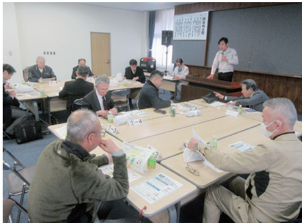
に水道料金の改定を行うとの事であった。

すなわち、全国的な課題であり、佐世保市においても例外ではない「水道施設の老朽化進行」「人口減少に伴う収入減少など経営基盤の脆弱性」「耐震化の遅れ」「計画的な更新と資金の備え不足」などの背景から、令和8年度より段階的