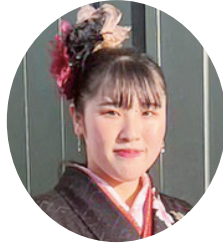
高彩 乃 橋邊 渡

家族や友人をはじめ沢山の 方に助けて頂き、無事二十歳 を迎えることが出来ました。 これからの感謝を忘れず日々 精進していきます。今年の日