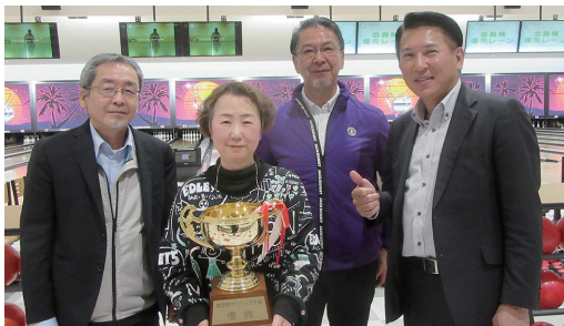
【団体の部】優勝 マルマツAチームの皆さん