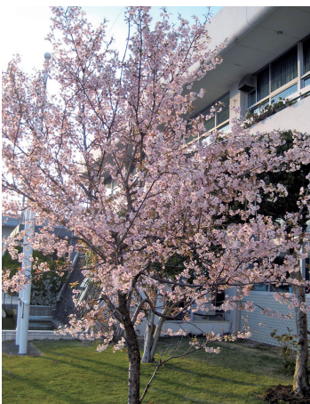
満開時(組合会館前庭)

た2本も、10年経過後東側の1本は枯れてしまい、西側もアスファルトの中なので中々見事な花は咲いてくれません。この際、組合に相談しましたところ、今一度植え