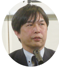
商工中金・稲木支店長