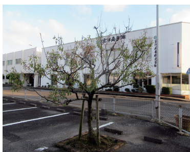
現在残る1本(組合会館前駐車場)

約18年前の卸団地組合設立40周年の時、私が苗を提供する事で組合会館前庭と駐車場の両南に各1本、計3本を組合記念事業としてヒマラヤ桜を植えさせて頂きました。事務局の前の1本は3〜4年間に12月に見事な花を咲かせて、長崎新聞と西日本新聞にも大きく掲載されました。ところが、間もなく虫に喰われたのか枯れてしまいました。駐車場の両端に植え