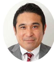
栄広エージェンシー